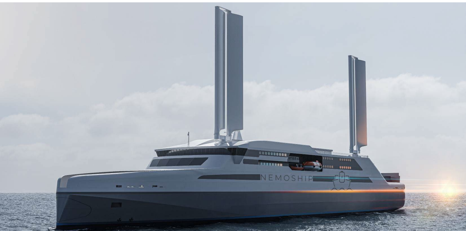
Projet de Ferry 100 % électro-vélique NEMOSHIP - © Stirling Design International – 2025