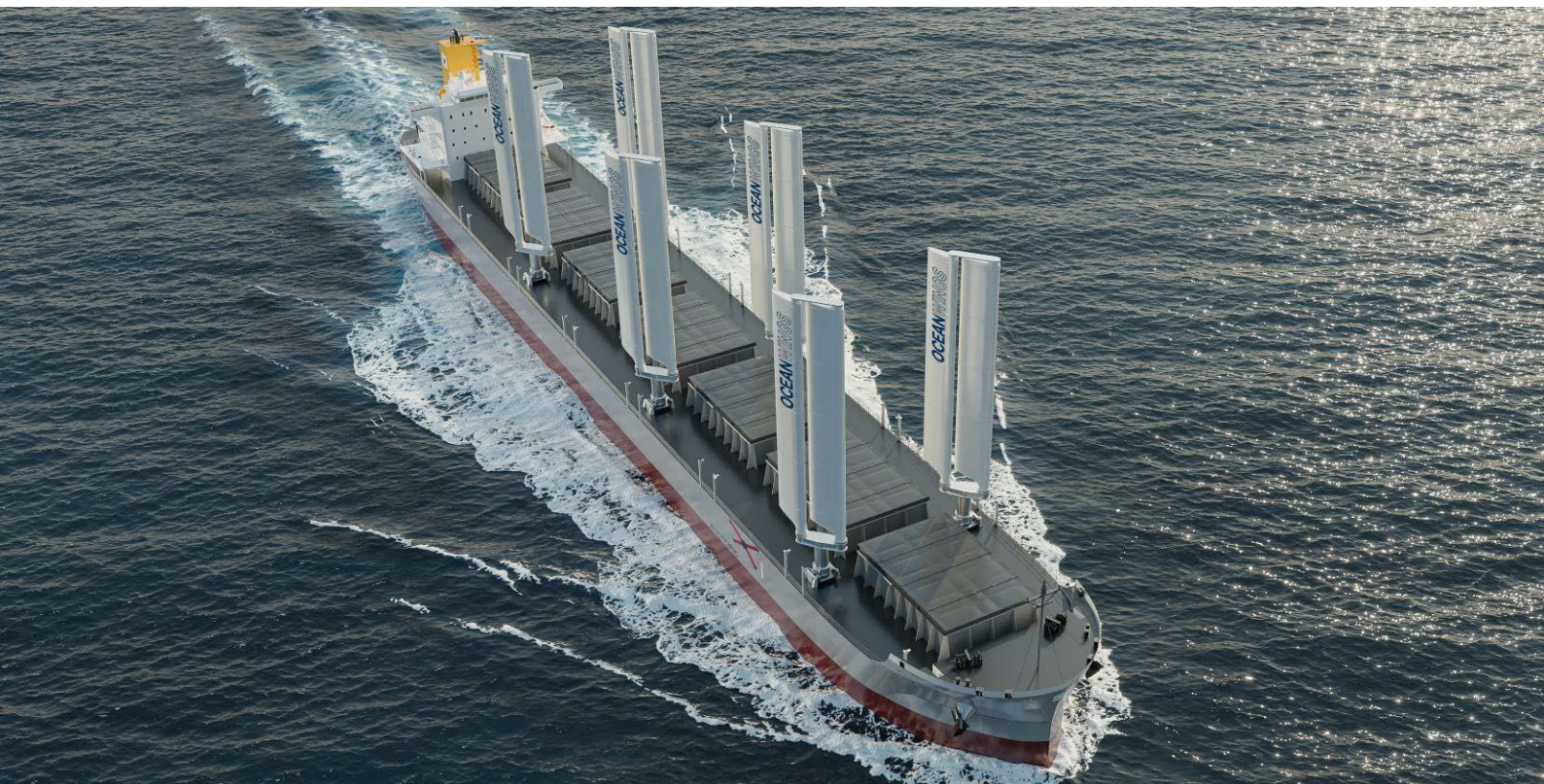
Projet de Vraquier Panamax WHISPER avec 6 ailes Oceanwings - © Stirling Design International - 2025